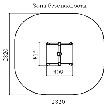
Рисунок 1. Минимальная зона безопасности тренажера «Рукоход»